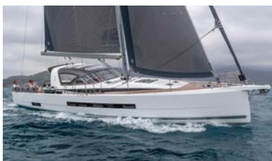
Jeanneau Yachts Luxury and ocean sailing Luxe et grande croisière