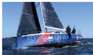
Sun Fast Race short-handed or with crew Course en solitaire comme en équipage