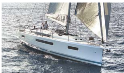
Sun Odyssey Elegance and performance Élégance et performance

Discover all these and more at www.jeanneau.com , or at your local Jeanneau Dealership.